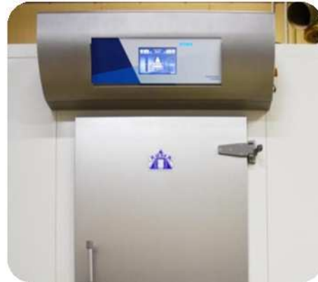
Cuadro K-Control con pantalla táctil