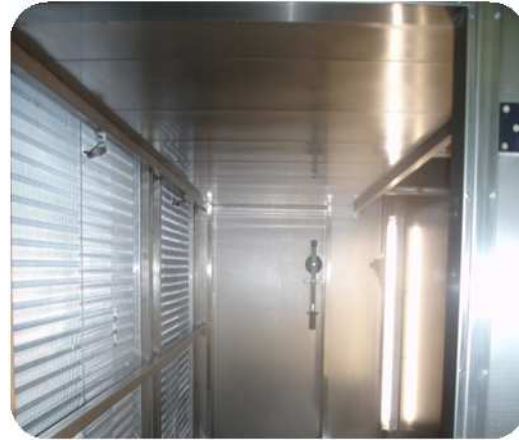
Falso techo en inox