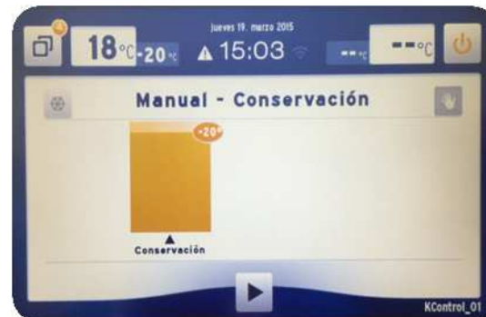
Cuadro fácilmente programable por el usuario