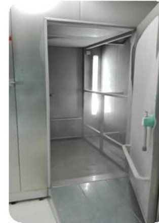
Rampa para carros (en opción)