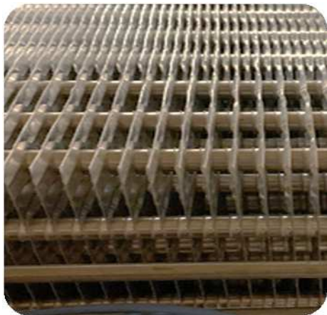
Mayor paso de aletas para evitar desescarches en largos turnos de trabajo.