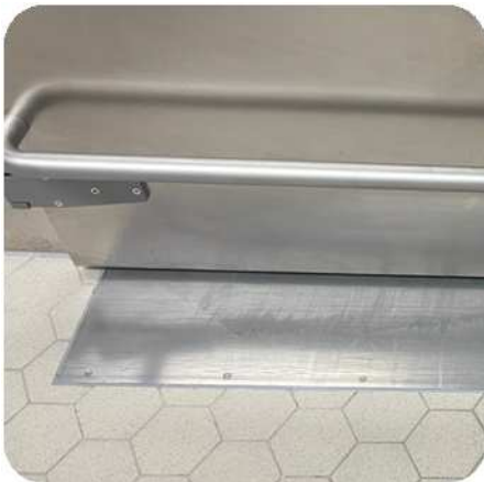
Suelo extendido en inox