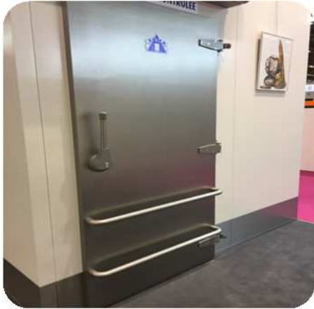
Puerta en inox