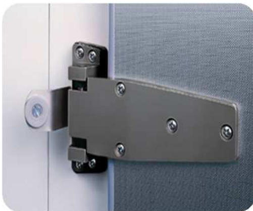
Bisagras reforzadas con tope de protección