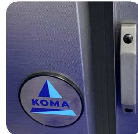
Puerta magnética (en opción)