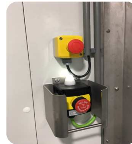
Pulsador de alarma y paro en el interior con sirena incorporada