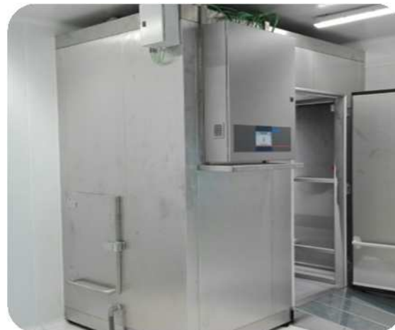
Exterior en inox aspecto tejido (en opción)