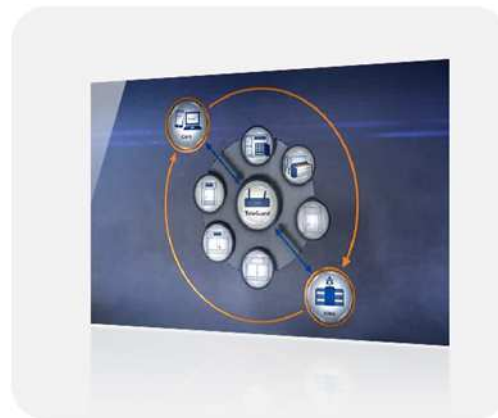
Conexión gratuita el primer año al servicio de monitoreo 24/24h de KOMA