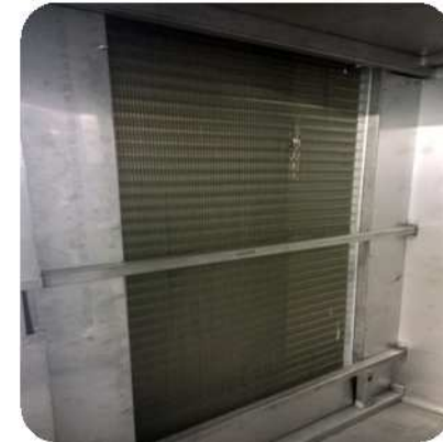
Protección interior en inox