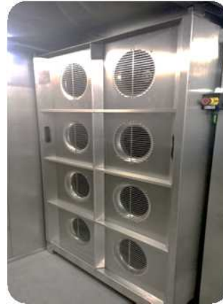
Columna de aspiración frente al evaporador removible para facilitar el mantenimiento