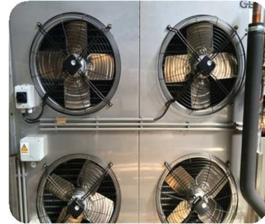
Carcasa evaporador y ventiladores fabricados en inox