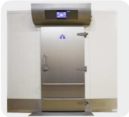
Exterior en acero lacado blanco con banda inox de protección en contorno