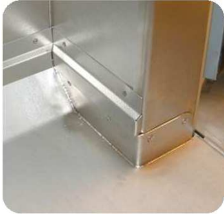
Suelo cubeta inox de 3mm