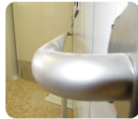
Protecciones inox en las puertas